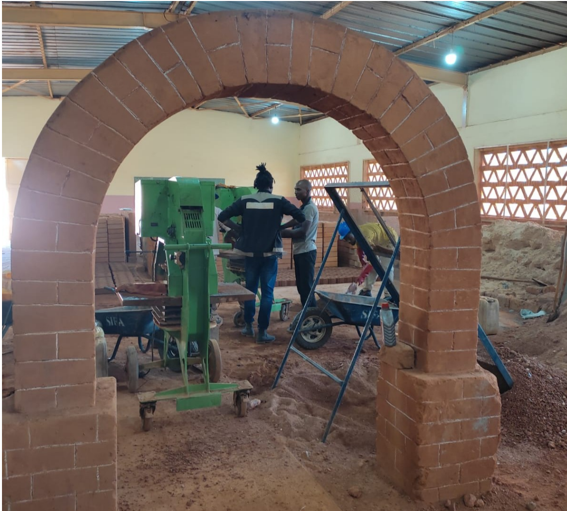
Centre de formation professionnel en brique de terre stabilisée (BTS), Labé (Guinée), déc. 2023

d'expertise, la coopération et la mise en œuvre de solutions innovantes dans le domaine de la formation et de l'insertion professionnelle.