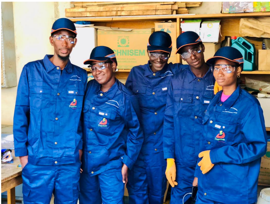
Jeunes bénéficiaires en formation avec Diapalanté, Saint-Louis (Sénégal), 2023