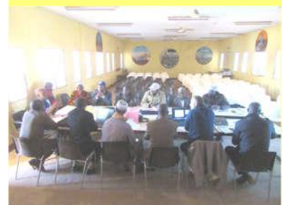
L'Inspecteur Régional de l'Education oriente les débats – 04/01/20