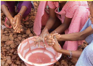
Sensibilisation sur le lavage des mains à Longoma — 04/01/19