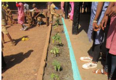
Création de parterres fleuris à Fady - 13/04/20