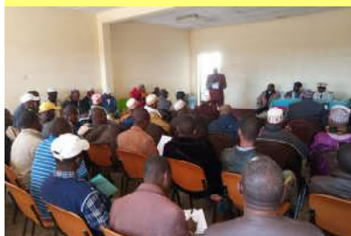
Forte mobilisation pour le CPPS de Mali - 18/01/20