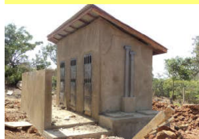
Latrines 3 cabines en construction à Bowe Boubha - 16/03/20