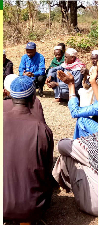
Prière autour du futur point d'eau de Donghol Fafabhe – 20/01/20

Le 20 mars, le CRCS s'est réuni pour faire le point sur l'avancement des activités depuis janvier 2020 et échanger sur la mise à jour des statistiques EHA. Enfin, le plan d'action allant de mars 2020 à décembre 2021 a été actualisé.