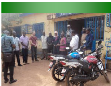
L'Inspecteur Régional de l'Éducation reçoit le matériel - 25/03/20