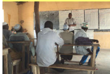
Formation du CDE de Donghol Fafabhe par le CAM - 10/03/20