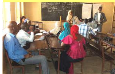
Formation EHA par le DSEE de Kouramangui - 11/03/2020