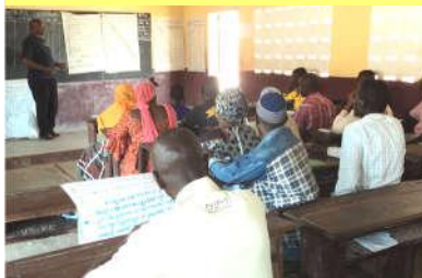
Formation du CDE de Dionfo-centre par le CAM - 20/03/20