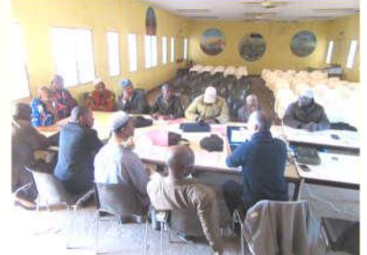
Echanges sur le choix des communes – 04/01/20