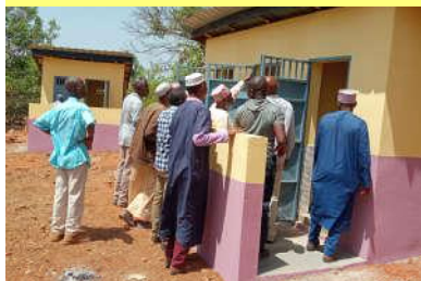
Inspection des latrines 3 cabines à Hinde - 16/03/20