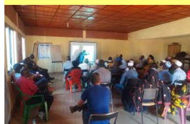
Une équipe communale concernée - 15/02/20