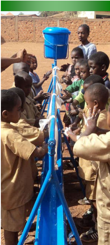
Sensibilisation sur le lavage des mains à Bowloko 2 — 22/02/19