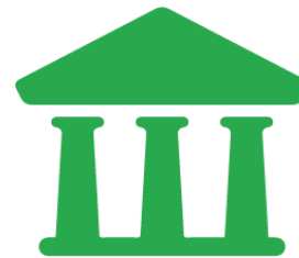
Appui à la gouvernance locale