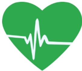
Accès aux services sociaux de base