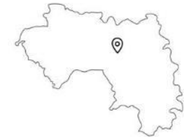
En Guinée (Labé)