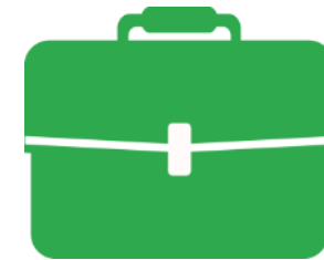
Formation et insertion professionnelle