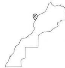
Au Maroc (Safi)