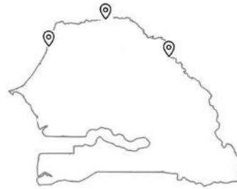
Au Sénégal (Saint-Louis, Podor et Matam)