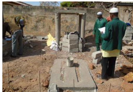
Point d'eau - 28/12/16