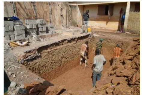
Bloc de latrines de 3 cabines - 28/12/16