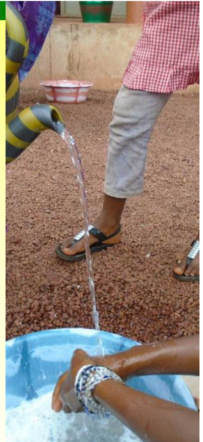
Sensibilisation sur le lavage des mains à l'école de Malea 2 - 04/11/16

La formation s'est déroulée pendant 4 jours à Lélouma en septembre puis 4 jours à Labé en octobre. Nous avons invité Mr Malal DIALLO de l'INRAP pour superviser le déroulement de la session de Labé. Il a fait profiter les participants de ses expériences et compétences pédagogiques. Le Partenariat a financé l'intégralité de ces formations.