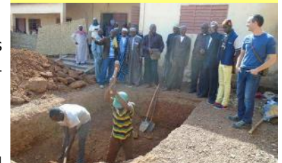
Démarrage des travaux à l'école de Thyndel - 13/12/16