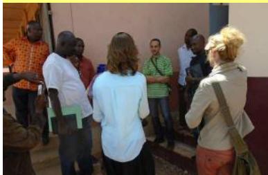
Présentation du PAEMS - 13/11/16