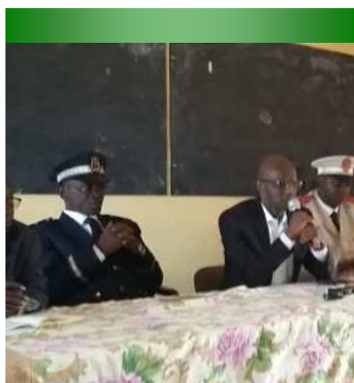
Ouverture du CRPE par le Ministre - 07/09/16