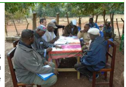
Echanges entre le Comité de Suivi Local et les techniciens - 22/12/16

L'objectif est de pouvoir constituer des dossiers de demande de financements à soumettre à de futurs partenaires.