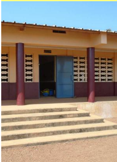
Les parents d'élèves ont financé la peinture de l'école - 19/12/16