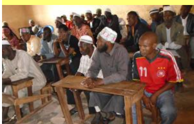
Des parents d'élèves attentifs à Thyndel - 08/11/16