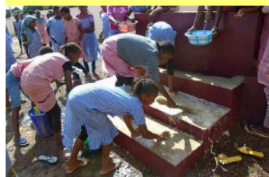
Entretien de la borne fontaine - 05/11/16

« L'école à elle seule ne peut garantir la santé de l'élève. Il est donc indispensable de développer la collaboration entre l'école et la communauté d'une part, l'école et les organisations de développement d'autre part. En somme, les participants s'engagent à vulgariser le contenu des documents reçus aux enseignants. »