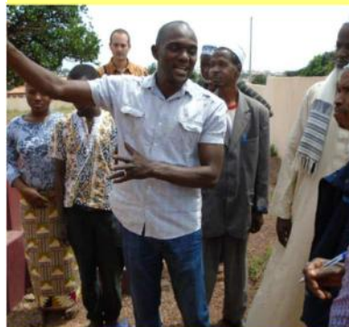
Le technicien de la SEG donne des conseils d'entretien - 23/10/16