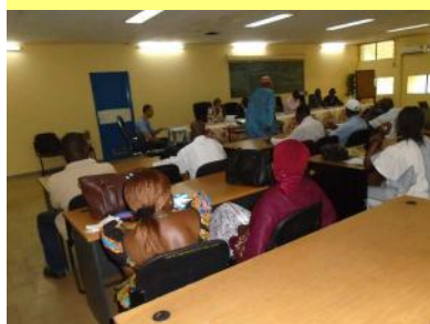
Les participants au début de l'atelier - 15/11/16