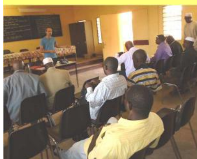
Présentation du PAEMS - 07/11/16