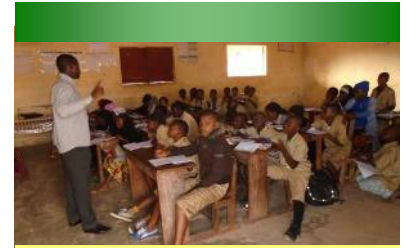
Evaluation des élèves sous la supervision du maître - 09/12/16

Depuis l'implantation, les travaux avancent normalement. Ils concernent le point d'eau (raccordement à la SEG, construction d'un château d'eau et d'une borne fontaine) et la construction de deux blocs de latrines (un de 2 cabines et un de 3 cabines).