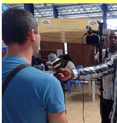
Interview du coordinateur du Partenariat par la RTG - 29/10/16