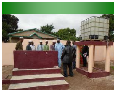
Point d'eau construit au sein de l'école de Malea 2 - 20/06/16

Un kit d'hygiène a été remis à l'école. Il est composé entre autres de savon, seaux, bouilloires, balais, serpillères, eau de javel, etc... Le renouvellement du matériel est à la charge de l'école.