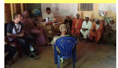
Debriefing de l'évaluation à Longoma - 17/10/16