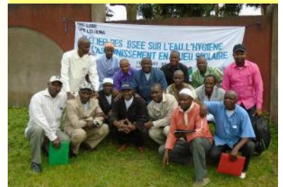
Les participants à Lélouma autour du Directeur Préfectoral de l'Education (DPE) - 22/09/16