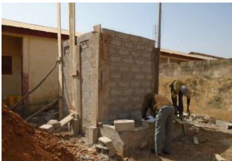
Bloc de latrines de 2 cabines - 28/12/16